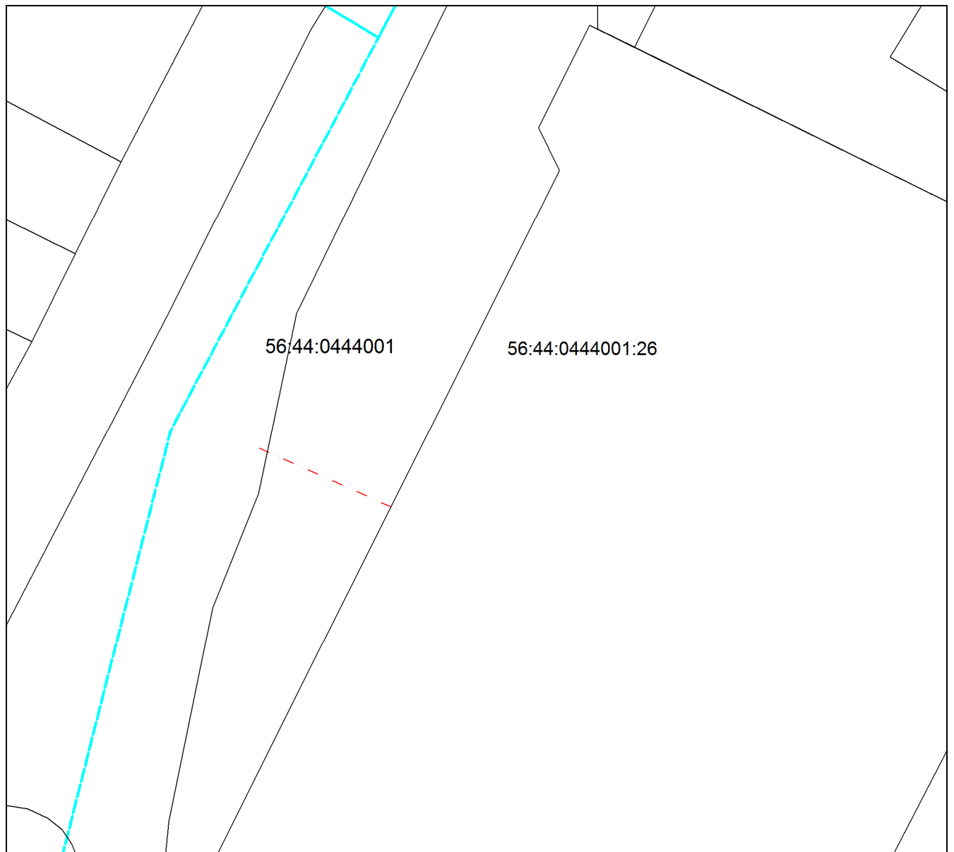
Схема расположения сооружения на земельном участке